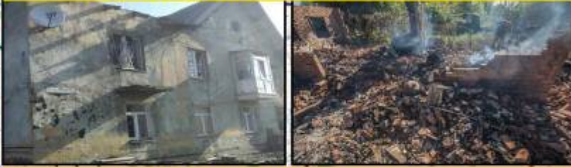
Результаты обстрелов н.п. Горлоака в августе 2016 года