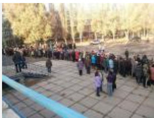
Линк к первому референдуму